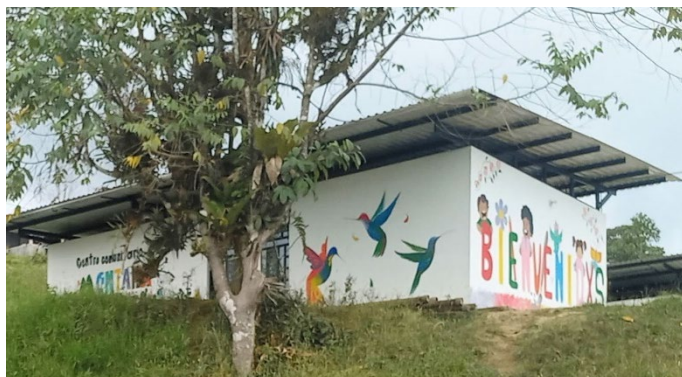
Espacio de cuidado Montaña Mágica