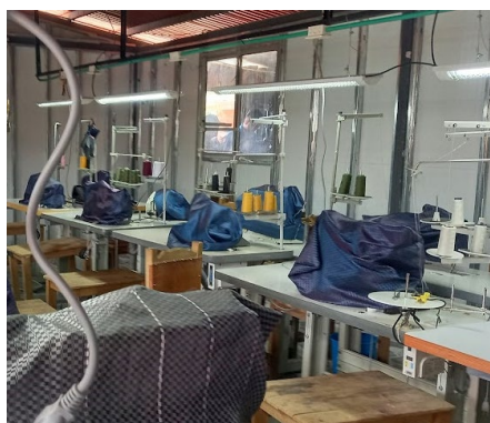
Proyecto colectivo textil Avanza

Esta investigación permitió identificar varias dificultades, reconocidas desde los liderazgos de los proyectos productivos, sin embargo como lo indican varios de ellos: