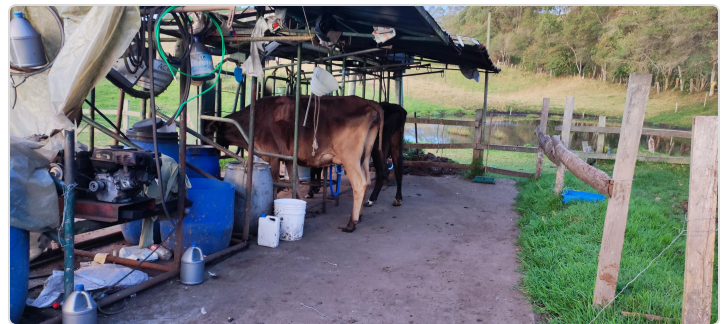
Figura 4. Lugar del ordeño finca el Encenillo.