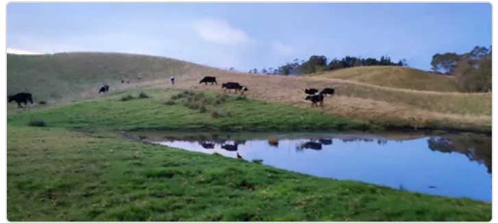
Figura 2. praderas de la finca el Encenillo

Los registros que se manejan en la finca El Encenillo son: registros de desparasitación y vacunación, registro de inseminación y monta natural, registros productivos de leche, y registros de suministro de suplemento alimenticio por animal. Para el fácil manejo de los registros y