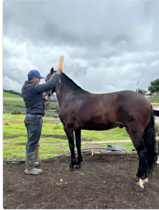
Figura 5. Medicamento veterinario