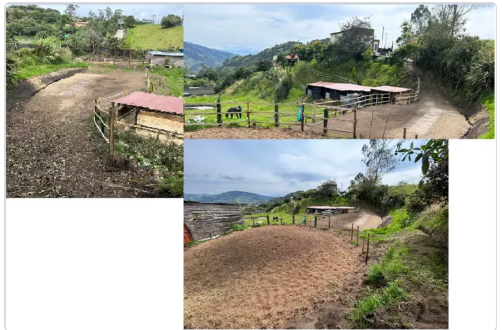
Figura 2. Picadero