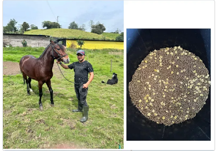
Figura 3. Alimento para equinos

⇒ La alimentación animal es de vital importancia en cada una de las etapas productivas, el fin de esto es suplir las necesidades alimenticias para que los animales tengan un excelente desarrollo y no sean de ninguna repercusión negativa en el consumo de los seres humanos. Actualmente en el criadero las orquídeas se suministra raciones a los ejemplares con el fin de suplir necesidad para las diferentes etapas las cuales son suministradas y recomendadas por zootecnista con el fin de obtener rendimiento de los ejemplares en cada una de sus actividades