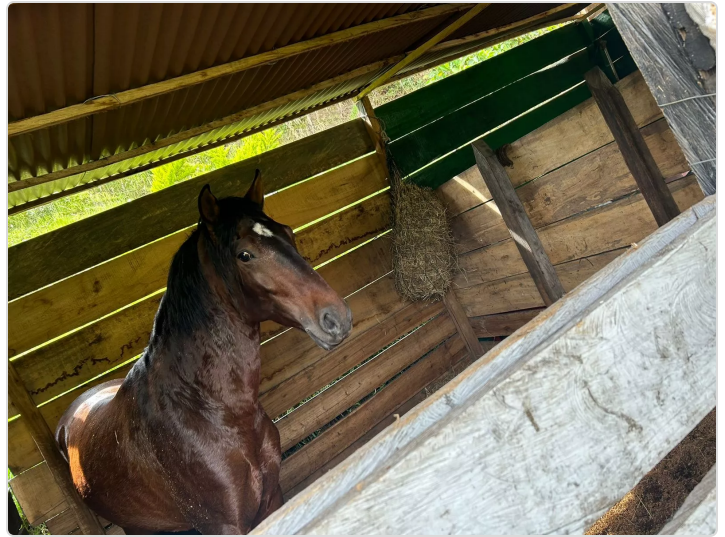
Figura 1. Pesebreras