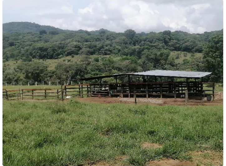
Figura 7 reserva forestal de la finca Criadero Buenavista

Se observa que la incorporación e implementación de las biotecnologías reproductivas, son un método positivo para llegar a mejorar la calidad genética de los animales a corto plazo, obteniendo animales de buena productividad, rentabilidad y logrando día por día a llegar a la finalidad de la ganadería, alcanzar pesos de 480 a 500 Kilogramos en 24 meses de edad del animal.