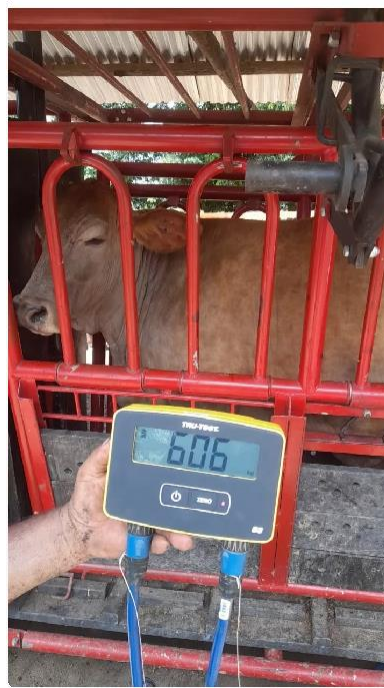
Figura 2 Pesaje de los animales en bascula-brete digital