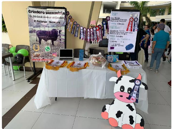
Figura 5 Reconocimientos obtenidos en la feria de AGROEXPO 2023.

↪ Cuando inicio la ganadería el objetivo de su propietario es llegar a ocupar los primeros puestos a nivel nacional en esta raza de ganado, logro alcanzado en la pasada feria de ganado que se realizó en la ciudad de Bogotá D.C, que se desarrolló en las fechas del 20 al 28 julio que se llamó AGROEXPO 2023, se cosecharon varios triunfos en las diferentes competencia que participaron los animales, como fue mejor Criador de ganado Simbrah, 4 primeros puestos en diferentes categorías, campeona ternera reservada, campeón ternero, campeón ternero reservado y Gran Campeón Nacional 2023, donde estos resultados son el fruto de varios años de trabajo, esfuerzo y compromiso en el mejoramiento de la calidad genética de los animales del predio.