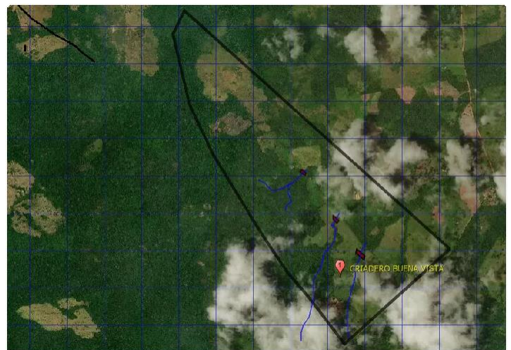
Figura 1 Mapa con polígono de la finca Criadero Buenavista