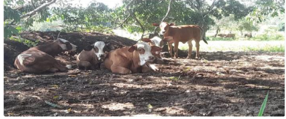
Figura 4 Embriones de la raza Simbrah de 4 meses de edad.

↪ La finca Criadero Buenavista a realizado la incorporación e implementación de biotecnologías reproductivas bovinas, en temas de reproducción asistida como es la Inseminación Artificial a celo natural y con sincronización del celo con productos hormonales, también ha realizado procesos de transferencia de embriones en la raza Simbrah, alcanzando buenos resultados en esta técnica reproductiva, lo que hace a esta ganadería ser única en el Departamento del Guaviare y estar a nivel con ganaderías de orden nacional, ya que estas cuentan con varios años de experiencia en el manejo de esta raza.