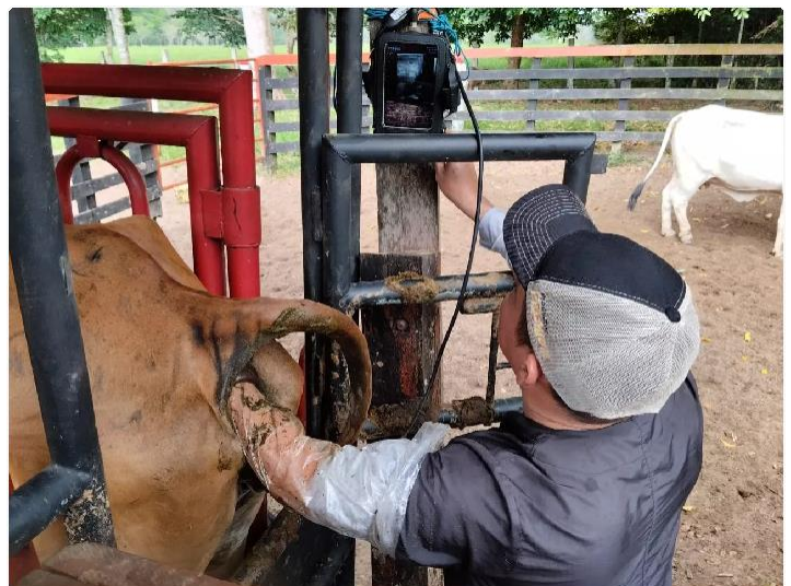
Diagnostico Reproductivo mediante ultrasonografía.