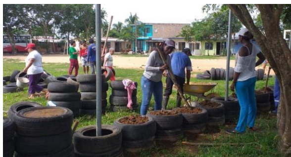
Foto 3. Adecuación cancha de futbol.