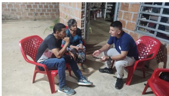
Foto 1. Reunión con integrantes de la JAC.