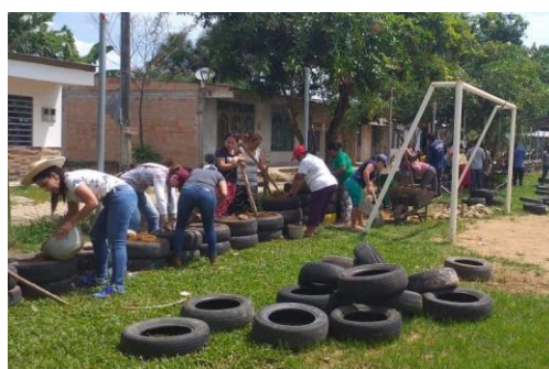
Foto 2. Jornada ambiental de reforestación.