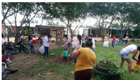
Foto 5. Adecuación zonas verdes.