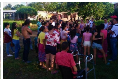
Foto 6. Encuentro de la comunidad.