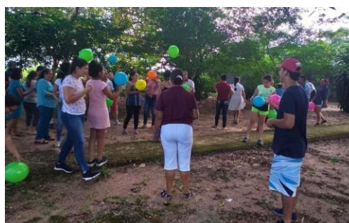
Foto 4. Pausa actividad de la comunidad.