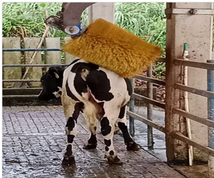
Figura 7. Bienestar animal

Las condiciones de bienestar animal están reflejadas en la condición corporal, salud y producción de los animales, estos cuentan con zonas de pastoreo silvopastoril reduciendo el estrés calórico, con suplemento de concentrado, vitaminas y minerales, en canoa, sala de espera antes del ordeño, cepillo masajeador, agua de muy buena calidad (potable) y el buen trato de los colaboradores. De igual manera los animales cuentan con un cepillo masajeador que esta ubicado en la sala de espera, estos se notan muy complacidos al usarlo.