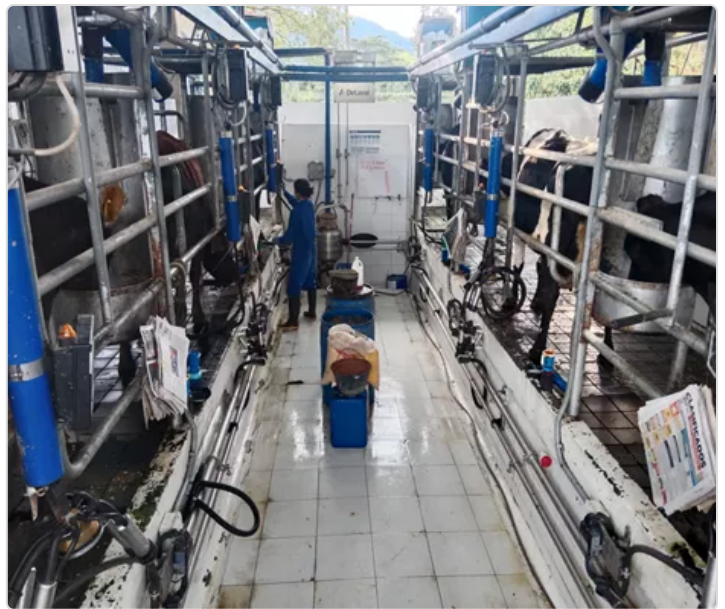
Figura 3. Infraestructura

En infraestructura cuenta con pediluvio, una sala de espera donde las vacas se toman agua después de llegar del potrero y descansan, la sala de ordeño con sistema Delpuro, oficina, bodega de concentrado, tanques de almacenamiento de leche, bodega de fertilizantes, botiquín, baños, manga o apretadero, bascula, brete donde se realizan prácticas de podología, invernadero para compostaje de estiércol, tanque estercolero donde se recogen los líquidos para ser distribuidos a los potreros como fertilizante orgánico.