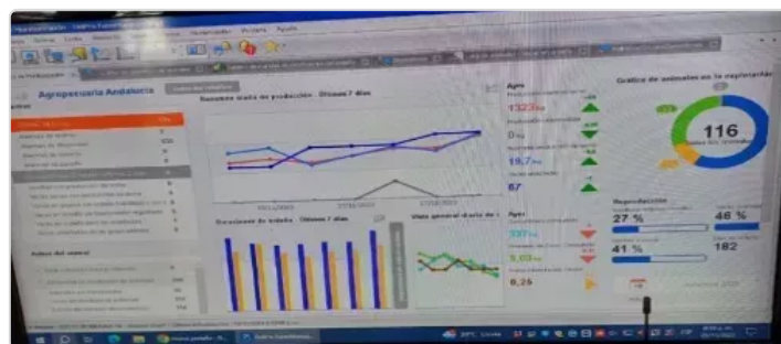
Figura 1. Metodología

La finca agropecuaria Andalucía es una finca ganadera especializada en producción de leche, cuenta con 36 hectáreas predomina la raza Yerhol que es un animal doble propósito, se caracteriza por su alta producción de leche. Esta finca con muy buenas pasturas donde predomina el pasto estrella, con muy buenos rendimientos en el aforo, siendo un promedio de kilos (1.5) de pasto disponible por metro cuadrado, la rotación de potreros cada 25 días, se fertiliza cuando sale ganado, con Nitrox, agrimin y gallinaza, con una recuperación de pradera de 24 días. La finca cuenta con sistema de ordeño de última tecnología “sistema delproo” aquí las vacas de ordeño cuentan con un shift y un sensor que identifica cada animal y de acuerdo a su producción le raciona el concentrado mecánicamente, se caracteriza por que todo es sistematizado, el operario no tiene contacto ni con la leche ni con el concentrado.