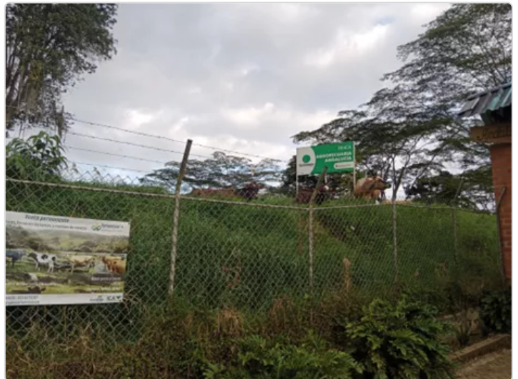
Figura 4. Alimentación

A los animales se les suministra concentrado el momento del ordeño de acuerdo a la producción (1 - 5) de leche, sal mineralizada, calcileche, ganaggras y el pasto en pradera.