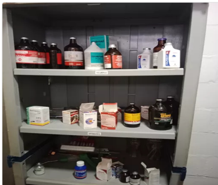
Figura 5. Manejo de medicamentos

Los medicamentos se manejan y se aplican de acuerdo a las recomendaciones de un veterinario el cual realiza el diagnóstico y médica a los animales cuando sea necesario. Estos están almacenados en sitios seguros.