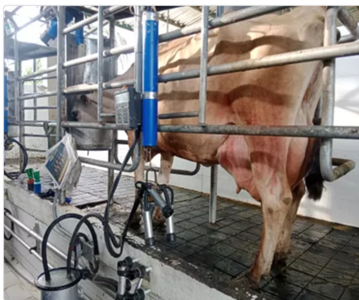
Figura 6. Bioseguridad

Se hace el efectivo el plan vacunación establecido por el ICA de acuerdo al calendario, para el Valle del Cauca este se realiza en dos ciclos y lo hace efectivo cogansevalle.