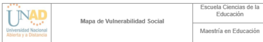
Mapa De Vulnerabilidad Social