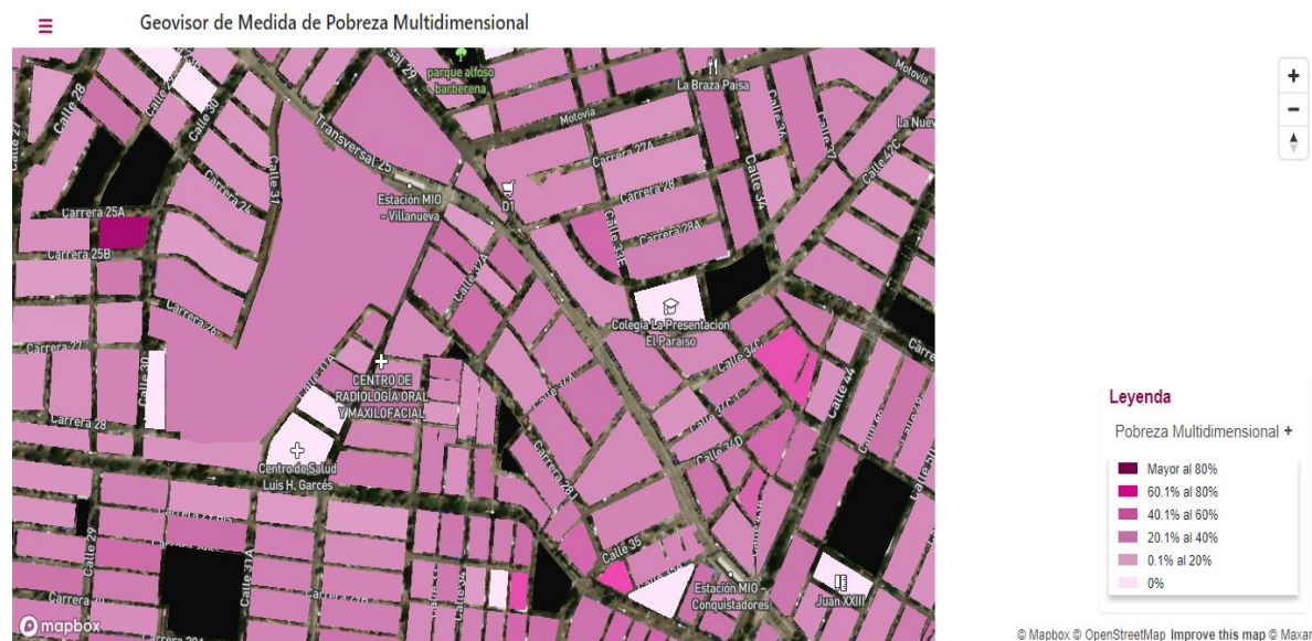
Figura 1 Pobreza multidimensional. Fuente. DANE Geo portal (2018) (Dane, 2023)

La Institución Educativa Comercial Ciudad de Cali – sede Buen Pastor, se encuentra ubicada al interior de las instalaciones del Centro de Formación Juvenil Buen Pastor, este Centro de Formación hace parte del sistema de Responsabilidad Penal para Adolescentes y se encuentra ubicado al sur oriente de la ciudad de Cali, en el barrio Villanueva, el cual hace parte de la comuna 12. Según lo reportado en el documento Cali en Cifras 2021, 620 de las viviendas que conforman el barrio se ubican en estrato dos y dos viviendas más se ubican en estrato uno, (Escobar Morales & Perilla Galvis, 2021), lo que tiene relación directa con los niveles de pobreza multidimensional del sector, que oscilan entre el 40.1% y 60%, según lo consultado en el Geo visor de Medida de Pobreza Multidimensional del DANE (2023)