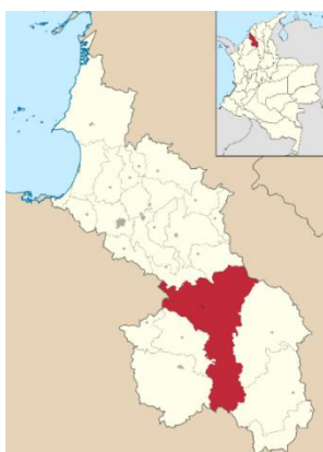
Localización de San Benito Abad