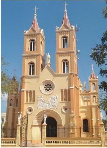
Basílica Menor del Señor de Los Milagros