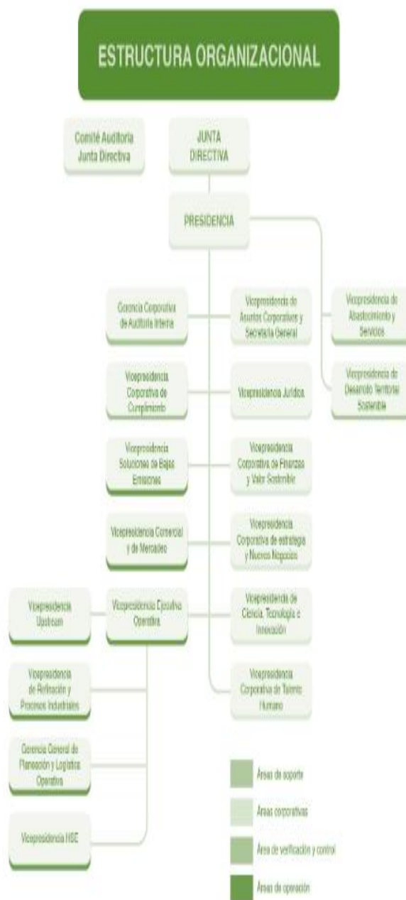
Figura 3 Mapa de acción