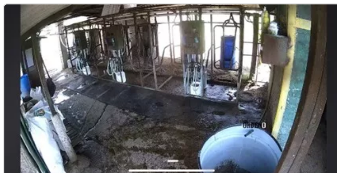
Figura 4. Instalaciones