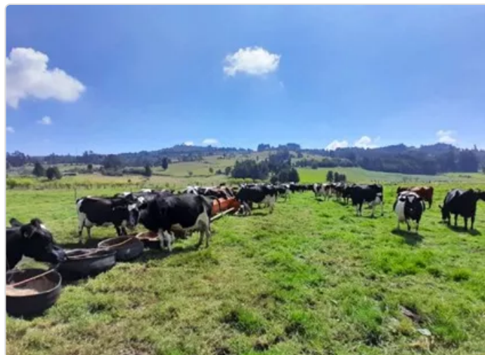
Figura 3. Praderas finca el solano