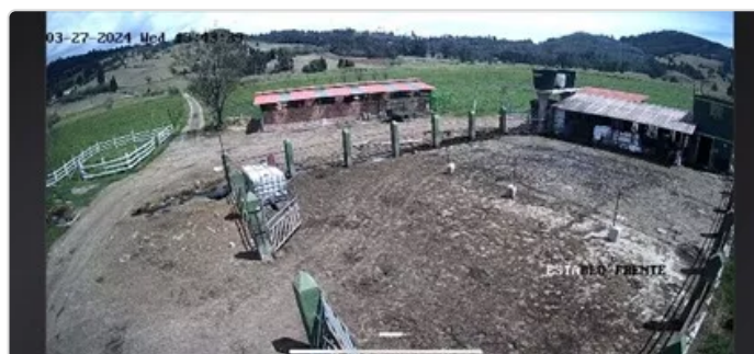
Figura 2. Corral