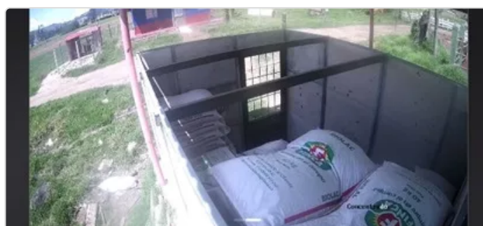
Figura 5. Almacenamiento