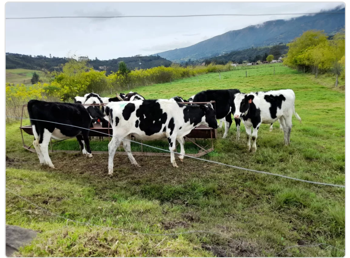
Figura 7. Ganadería finca el solano

⇒ La finca el Solano ha tenido un crecimiento exponencial en los últimos 3 años, debido a que entendimos que todos los procesos deben ser parte integral para nuestro correcto funcionamiento, entendimos que necesitábamos puntos de control y metas más claras para poder avanzar más rápido. Hemos logrado consolidarnos como una de las producciones de leche más grandes de la región con la mayor calidad de leche, llevando así 3 años trabajando con Alquilería. Tenemos claras nuestras metas, y sabemos que aunque el camino es largo, el trabajo organizado nos va a llevar siempre a donde queramos ir.