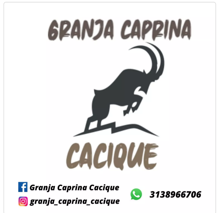
Figura 3 Identificación de la granja

Esta es una granja que desde el año 2014 ha venido desarrollando sus actividades en el sector caprino para la producción de animales para sacrificio manejando el ciclo productivo completo y entregando los animales en pie ya sea para mejoramiento genético o para consumo. Granja caprina Cacique S.A.S. es una empresa constituida legalmente desde el año 2022.