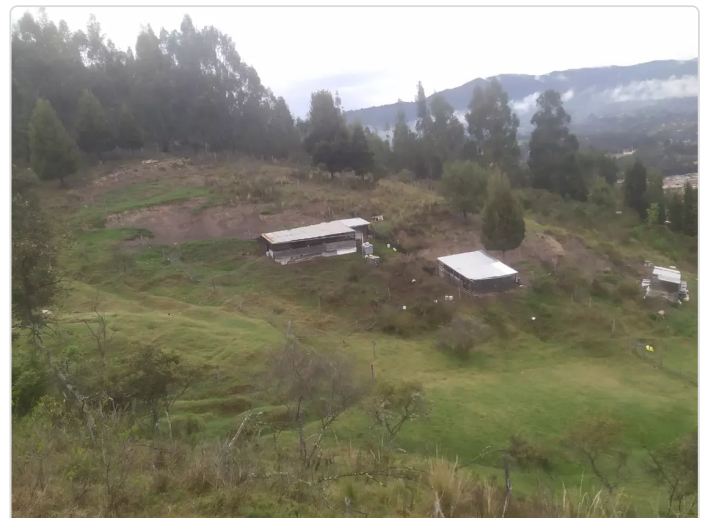
Figura 2 Corrales de manejo