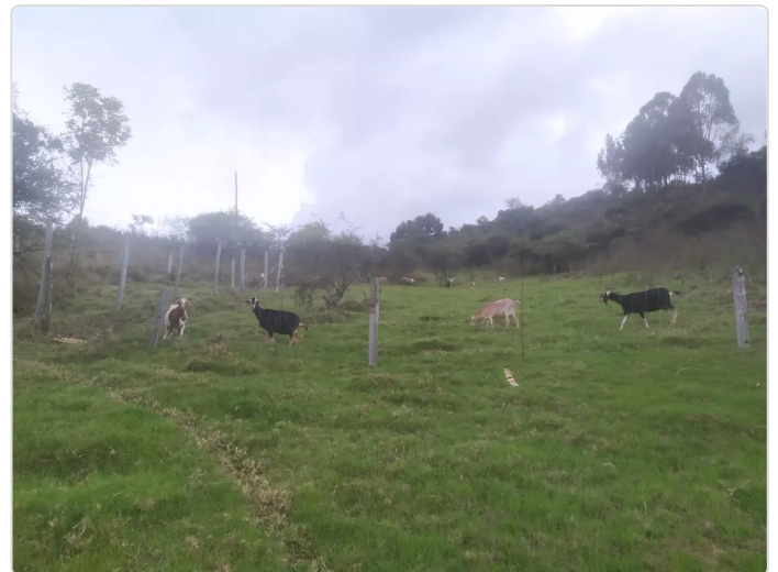
Figura 1 Delimitación potreros pastoreo