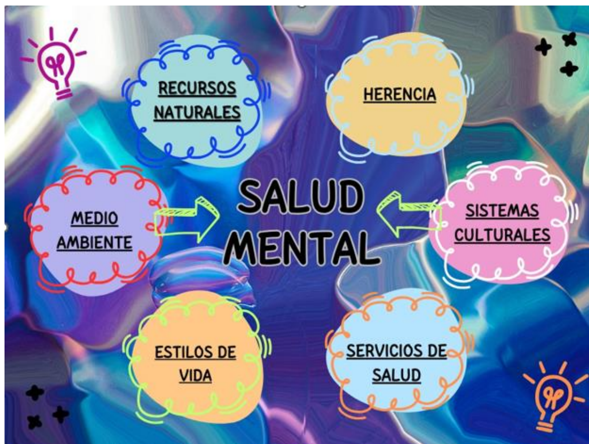
Mapa Mental Salud Mental