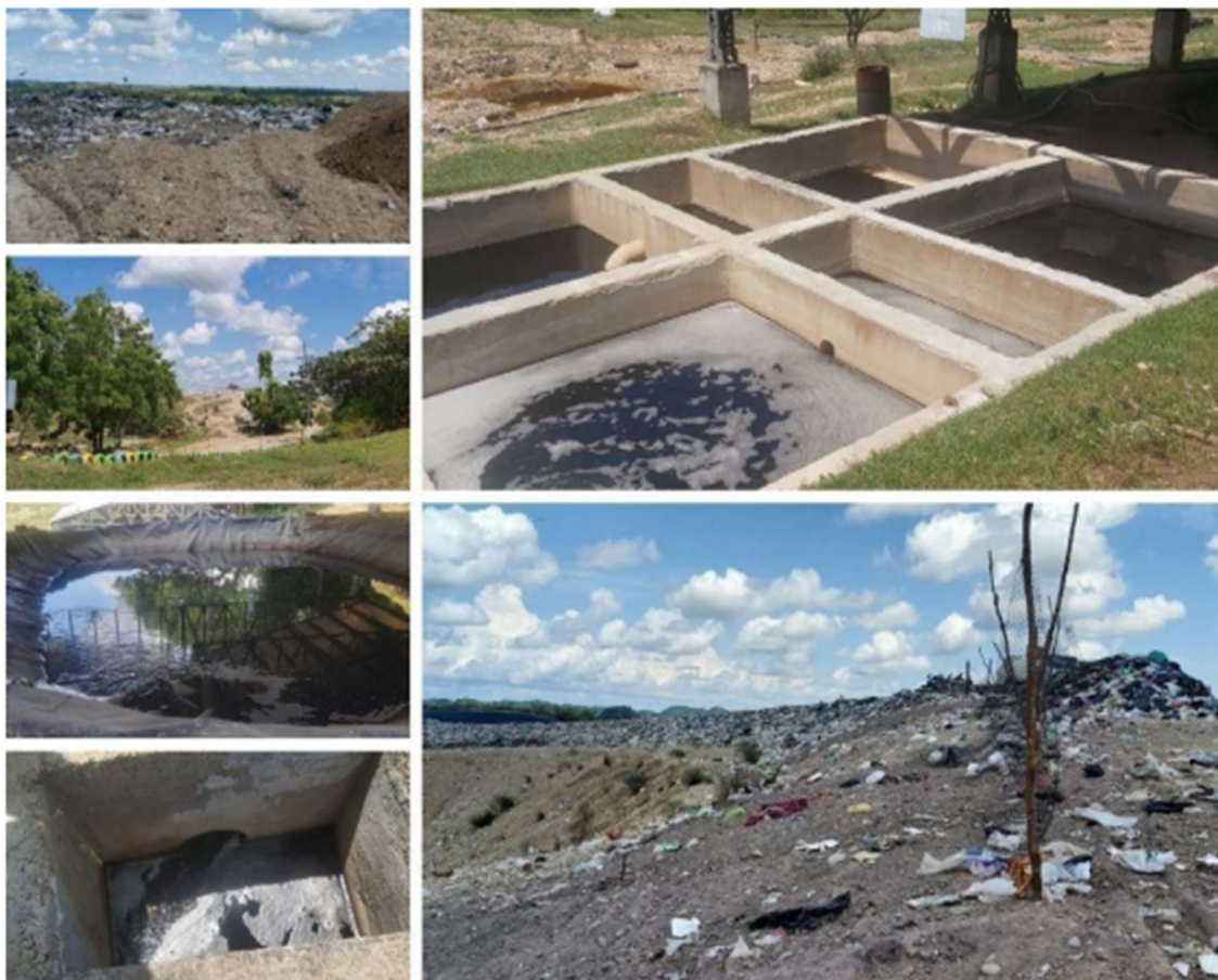
Gráfico 1. Relleno sanitario Regional La Doradita.

“Tecnología Basura” establecido en el plan de ejecución del PBOT 2013 – 2027. (Alcaldía municipal de La Dorada Caldas, 2013 – 2027).