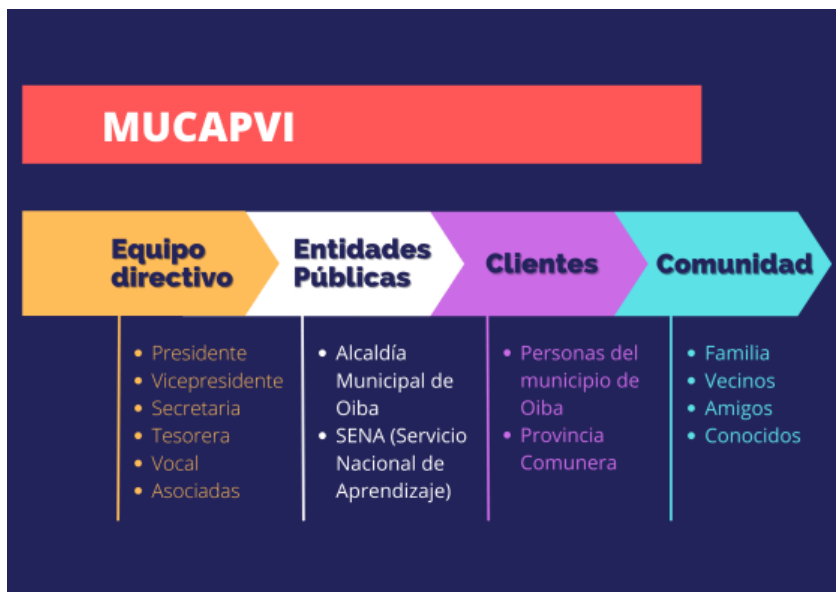
Conjuntos de Acción

Fuente. Elaboración propia, con base a la información suministrada por la(s) OSP