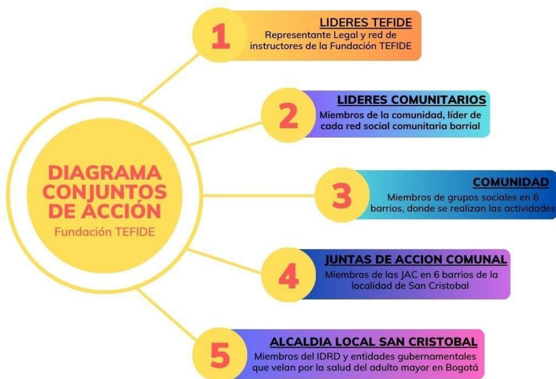
Diagrama de Conjunto de Acciones