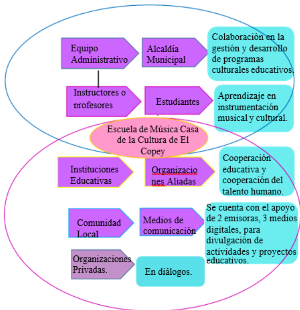
Gráfico Conjuntos de Acción