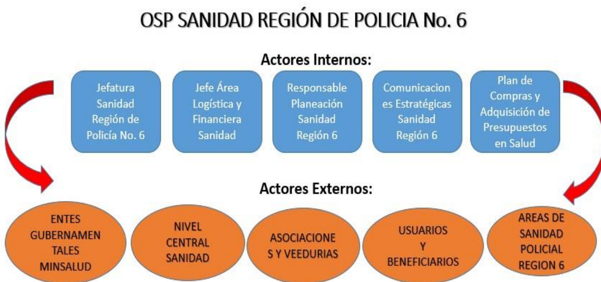
Figura 2 Conjuntos de Acción