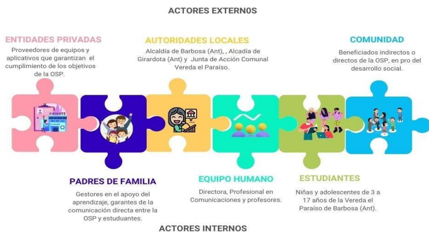
Conjuntos de Acción