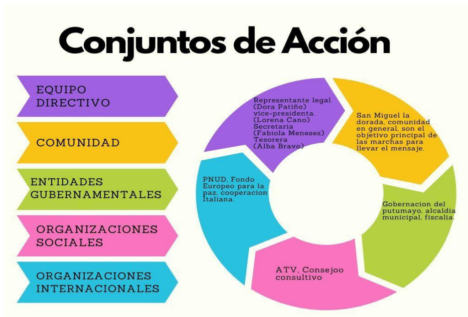
Conjuntos de Acción