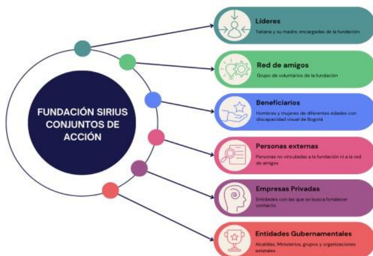
Diagrama de Conjuntos de Acción Fundación Sirius