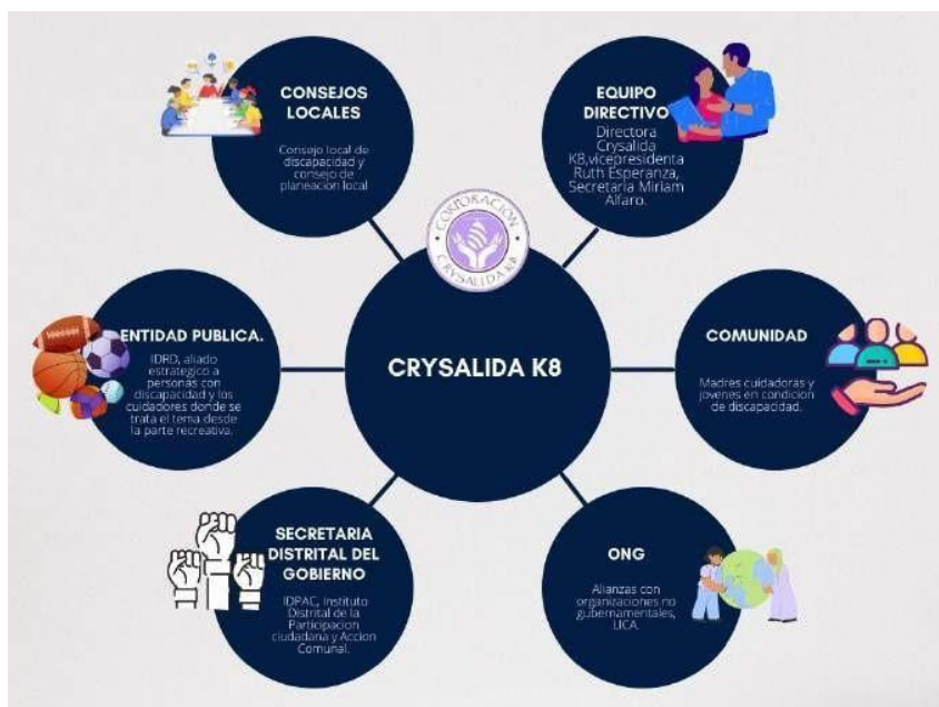
Conjuntos de acción OSP Crystalida K8