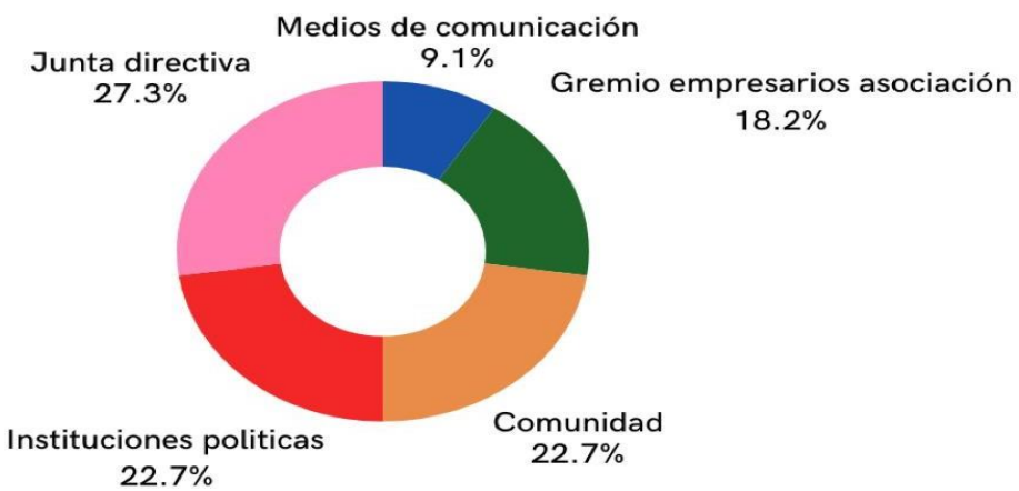
Conjuntos de Acción