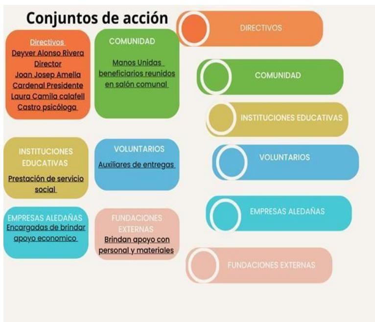
Conjuntos de Acción