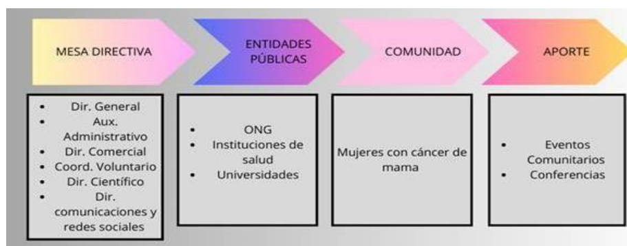
Conjunto de Acción de la Fundación SENOsama