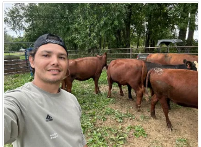
Figura 2. instalaciones