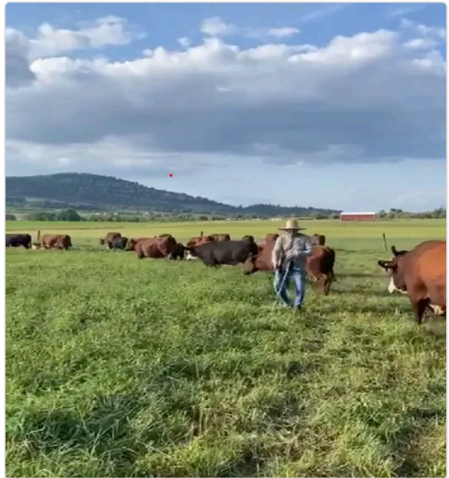
Figura 3. Producción y manejo del predio El Paraiso.

⇒ En la finca se manejan las razas Brahman, Angus y unos cruces con Hereford. Cuenta con cerca eléctrica, con un sistema eficiente de manejo que incluye el uso de pastoreo rotativo, lo que optimiza el uso de forraje y mejora la salud del suelo. Los animales son movidos entre diferentes potreros cada 2 días, según los aforos del forraje, lo cual son 40 animales por cada 800 metros cuadrados, lo que permite que el pasto tenga tiempo suficiente para recuperarse. La finca produce aproximadamente 115 bovinos al año destinados a ceba, con un peso promedio de 450 kg; en la finca realizan baños cada 21 días para el control de ectoparásitos, como la mosca y el nuche. De igual forma, se purgan entre cada 3 y 4 meses para el control de hemoparásitos. En el predio cuentan con sus respectivos medicamentos, sales mineralizadas para su prevención y alimentación de los semovientes.