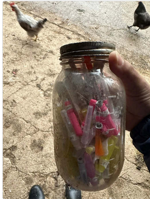
Figura 5. Bioseguridad del predio El Paraiso.