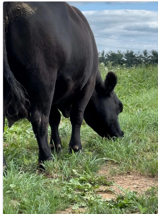
Figura 6. Nutrición y alimentnación del predio El Paraiso.