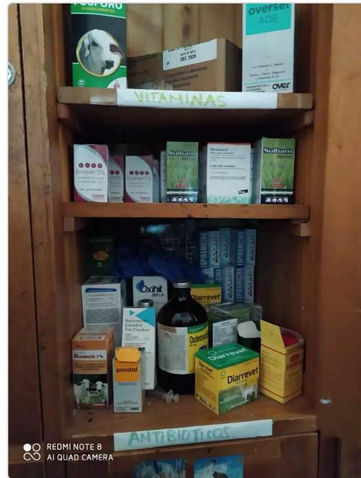
Figura 7. Medicamentos del predio El Paraiso.