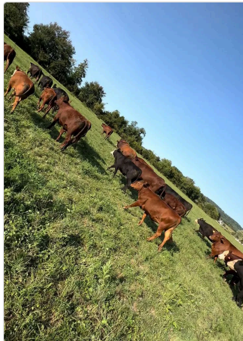
Figura 4. Razas del predio El Paraiso.

El Angus es una raza productora de carne, reconocida por su precocidad reproductiva, facilidad de parto, aptitud materna y longevidad. Los ejemplares de la raza deben poseer buenas masas musculares y producir carne de buena calidad. Deben ser voluminosos, de buena profundidad y con un buen balance o armonía de conjunto. Sus formas deben ser suaves, de contornos redondeados, con facilidad de terminación y sin acumulaciones excesivas de grasa. El temperamento debe ser activo, pero no agresivo, y ágil en sus desplazamientos, demostrando aplomos correctos y articulaciones fuertes. La piel debe ser medianamente fina, elástica, cubierta de un pelaje suave, corto y tupido de color negro o colorado.