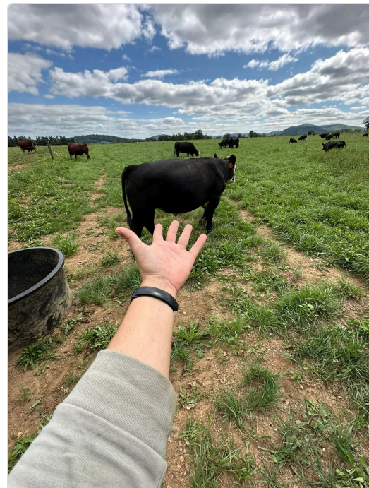
Figura 8. Bienestar animal del predio El Paraiso.