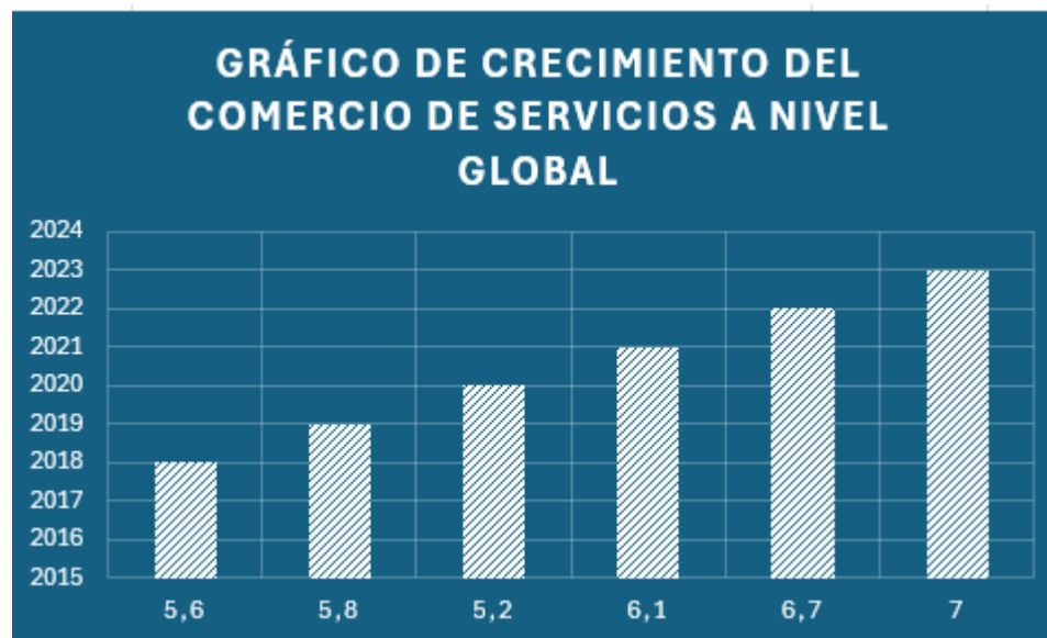
Gráfico A.3: Crecimiento del Comercio de Servicios a Nivel Global (2018-2023)

Fuente: International Trade Centre, 2023.