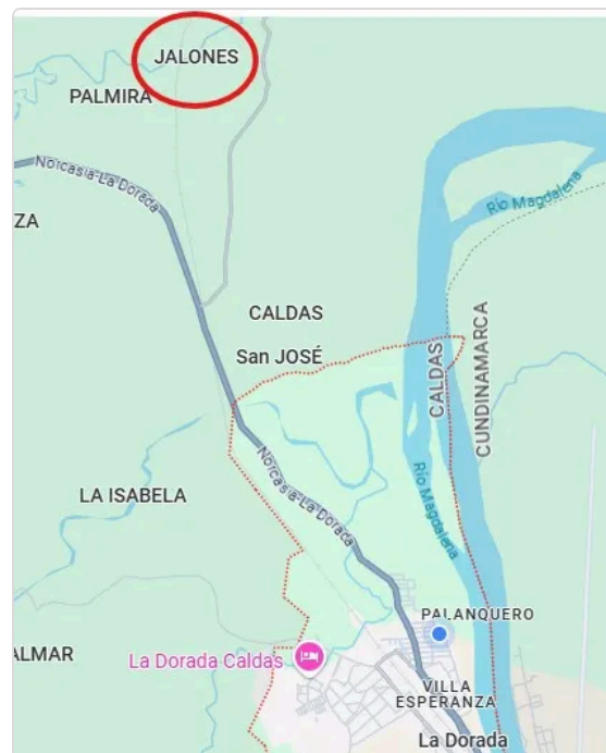
Figura 1. Ubicación de la finca Brisas de Pontoná