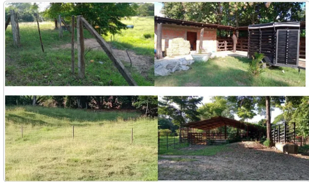
Figura 2. Instalaciones finca