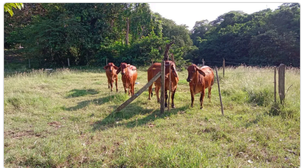
Figura 6. Brahman rojo comercial

⇒ Se cuenta con un buen manejo en la sanidad de los animales, se cumple a cabalidad con el plan de vacunación que exige el ICA en esta zona, no se presentan enfermedades, y se realiza cada semestre desparasitación de parásitos internos y externos