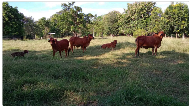
Figura 3. Brahman Cebú rojo comercial