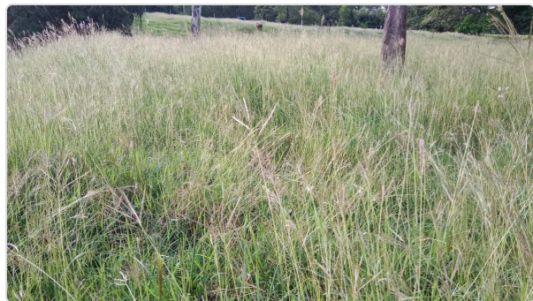
Figura 4. Pasto Angleton Climacuna

Se ofrece a los animales silo de maíz, y concentrado MANA peletizado Reg ICA 1831. La finca tiene un proyecto sobre poder cortar pasto como el CUBA 22, este se encuentra ya sembrado en la finca.