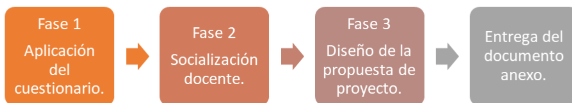
Fases del Desarrollo Metodológico del Proyecto