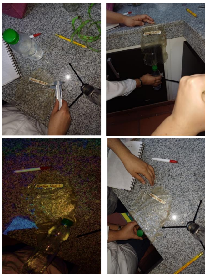
Figura 9 Evidencias medición nivel 1

Nota. Resultados de las resistencias mecánicas nivel 1