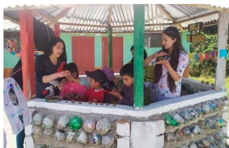
Creación de la Bola de Barro