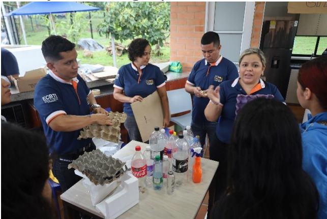
Fase 2 Entrega de material de trabajo a cada grupo