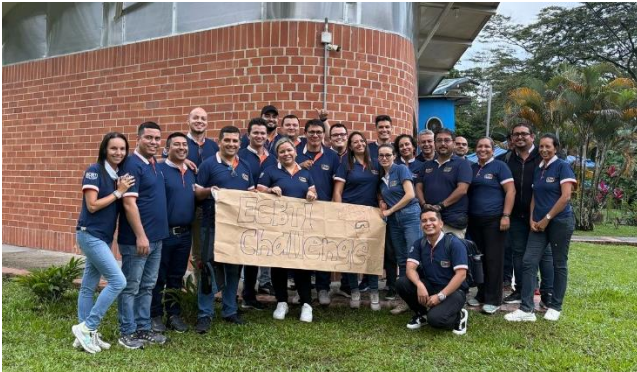
Equipo de tutores