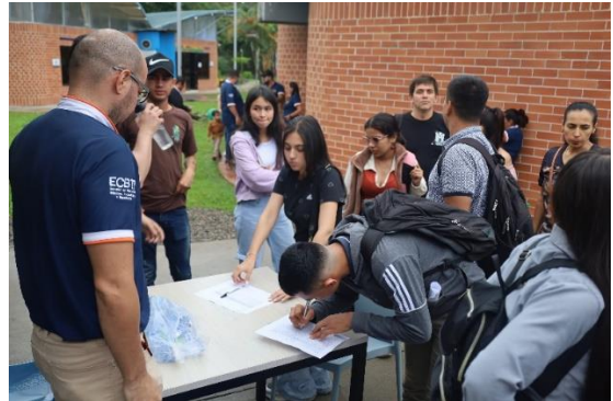
Fase 1. Registro de los participantes