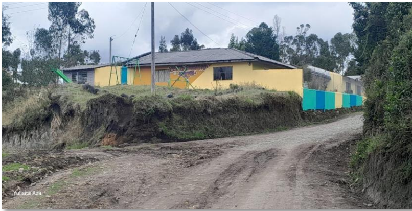
Centro Educativo el Romerillo