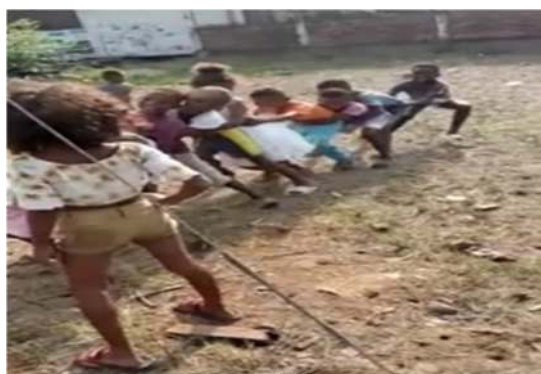
Niños y Niñas Jugando a la Yuquita