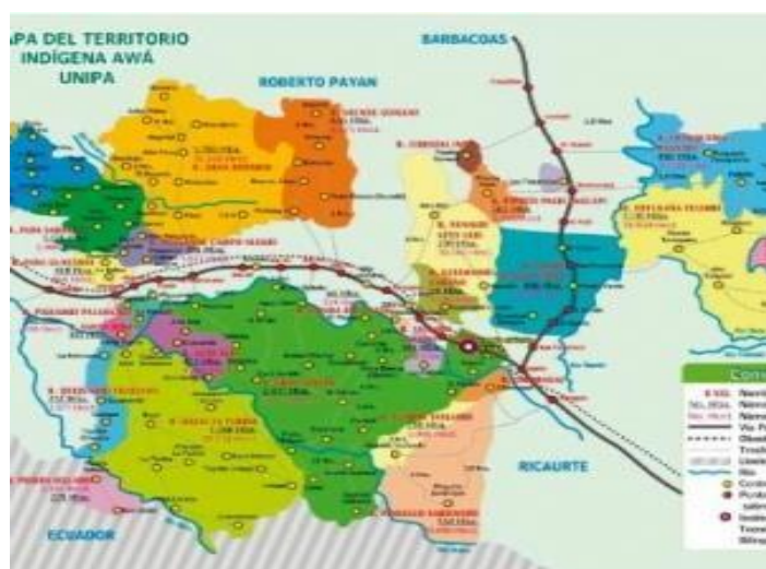
Mapa del Territorio Indígena Awá UNIPA

Nota. Mapa de la comunidad de Predio El verde ubicado en el municipio de Barbacoas.