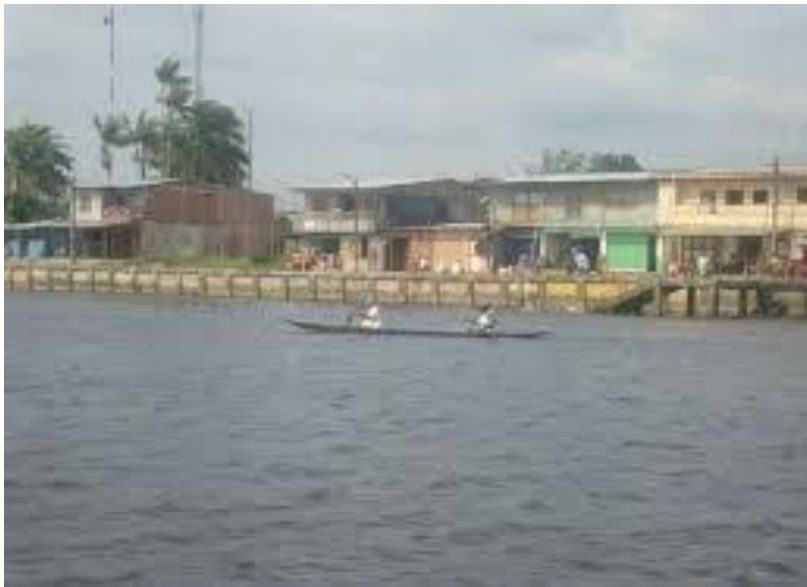
Foto del Municipio de la Tola Nariño

Nota. Foto del municipio de La Tola Nariño. Tomado de (LOA, 2013)