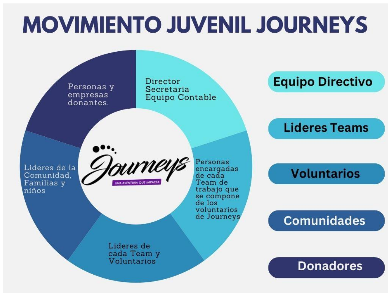
Grafico de Conjuntos de Acción