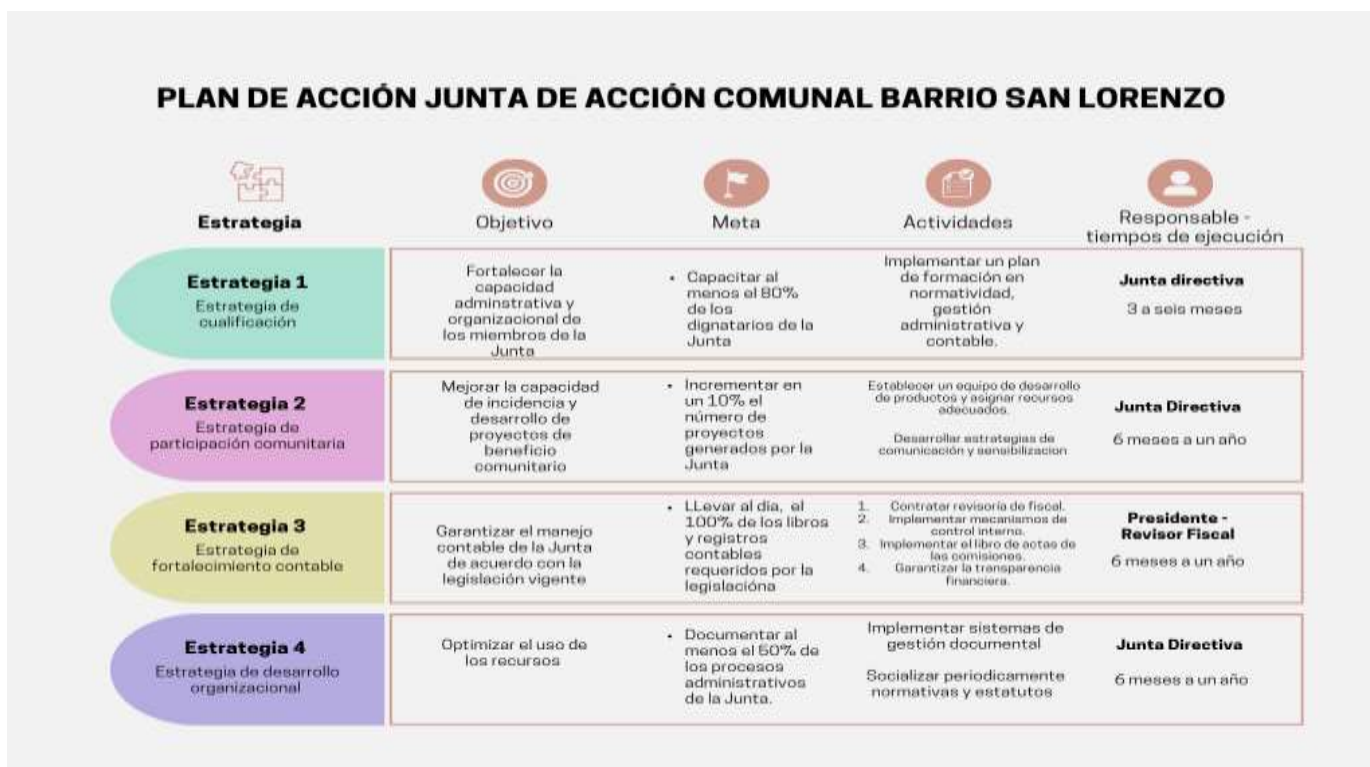
Plan de Acción Junta de Acción Comunal Barrio San Lorenzo

Nota. elaboración propia a partir de análisis y diagnóstico institucional