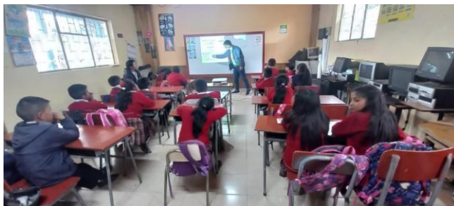
Primera secuencia didáctica (2024)

Fase de Aplicación y Práctica (Evaluación):