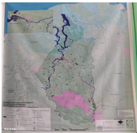
Mapa del resguardo Turbio Bacao

Tomado de. Archivo fotográfico desde la cartografía de la Comisión de la Verdad y ACIESNA (2020). Nota.