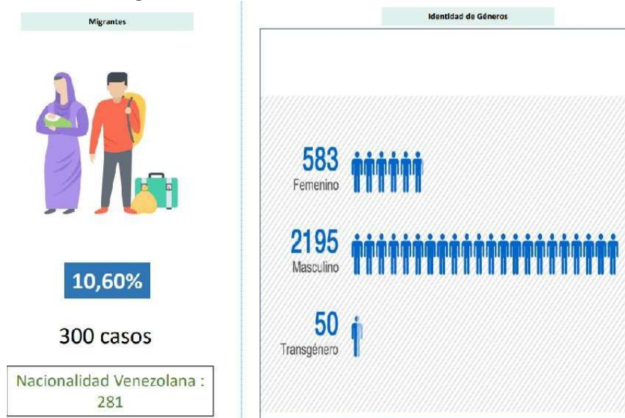
Figura 4 Poblaciones Especiales Periodo II 2025 Pr

Nota. La figura muestra los casos de personas migrantes y por identidad de género. Instituto Nacional de Salud (2025).