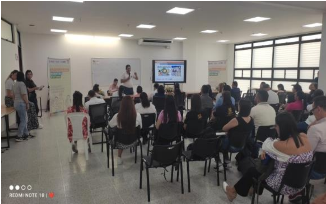
Toma de datos de cada participante