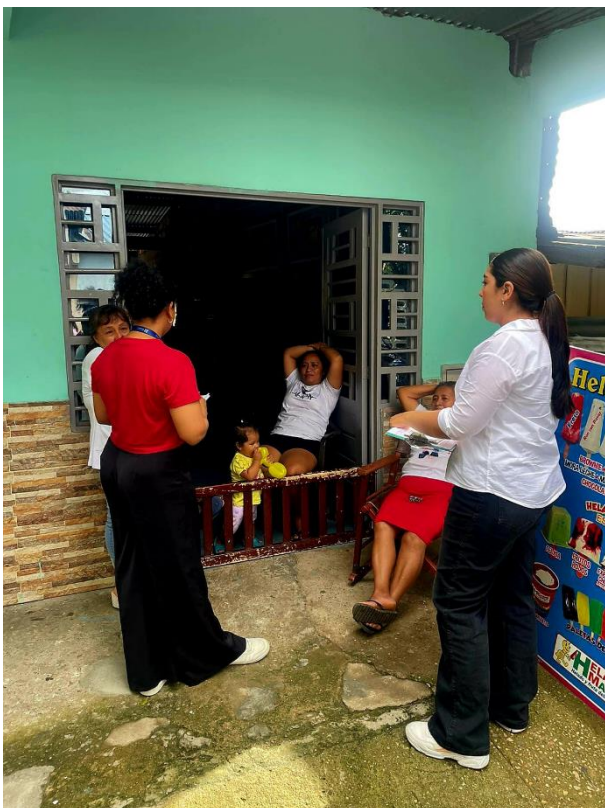
Nota. Fotografía abordaje psicosocial puerta a puerta en el barrio Rodrigo Turbay