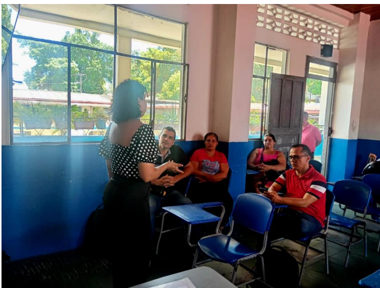
Nota. Fotografía Intervención psicoeducativa en la institución Educativa Sagrados