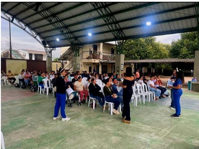
Nota. Fotografía de escuela de padres en la institución educativa Antonio Recuate