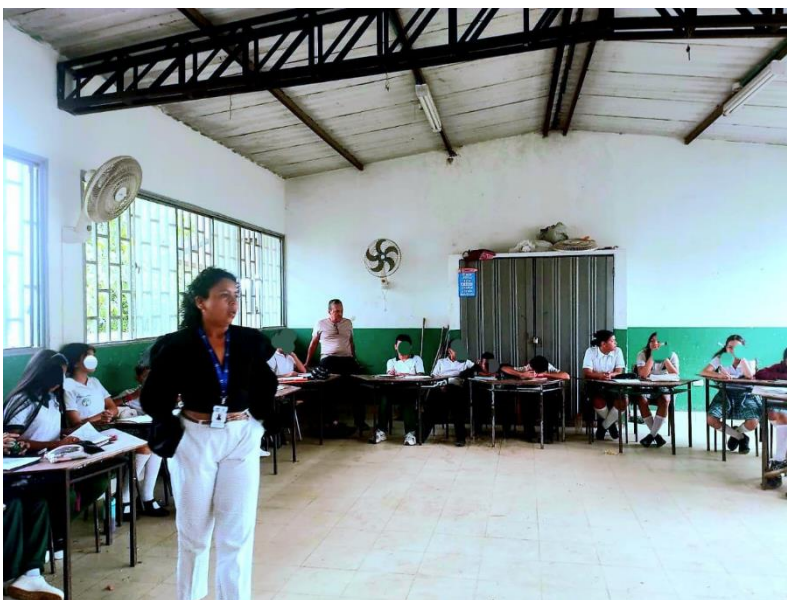
Nota. Fotografía Intervención psicoeducativa en la institución Educaitiva Buinaima