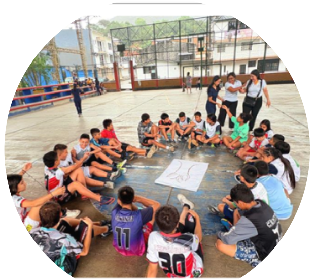
Equipo dinamizador y comunidad participante

En conjunto con los semilleros Sinergias y Psitesvic de la UNAD, la CIPA territorial busca comprender los factores de riesgo psicosocial presentes en los entornos deportivos y comunitarios, y promover acciones que fortalezcan entornos seguros, inclusivos y protectores para la población adolescente.