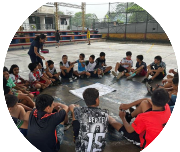
Equipo dinamizador y comunidad participante