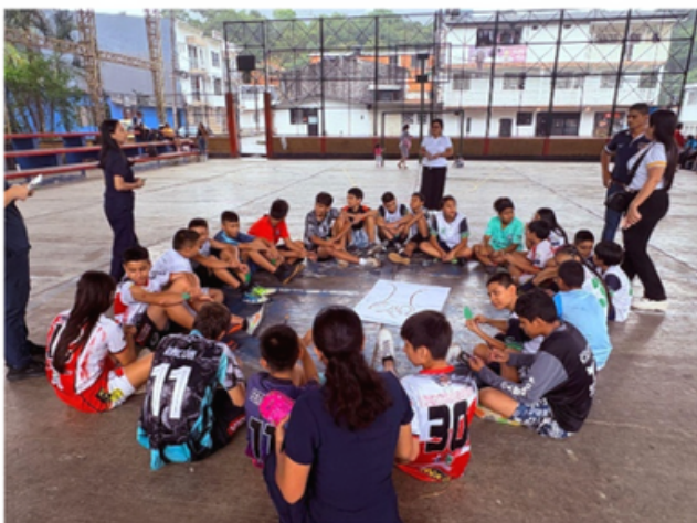
Equipo dinamizador y comunidad participante.