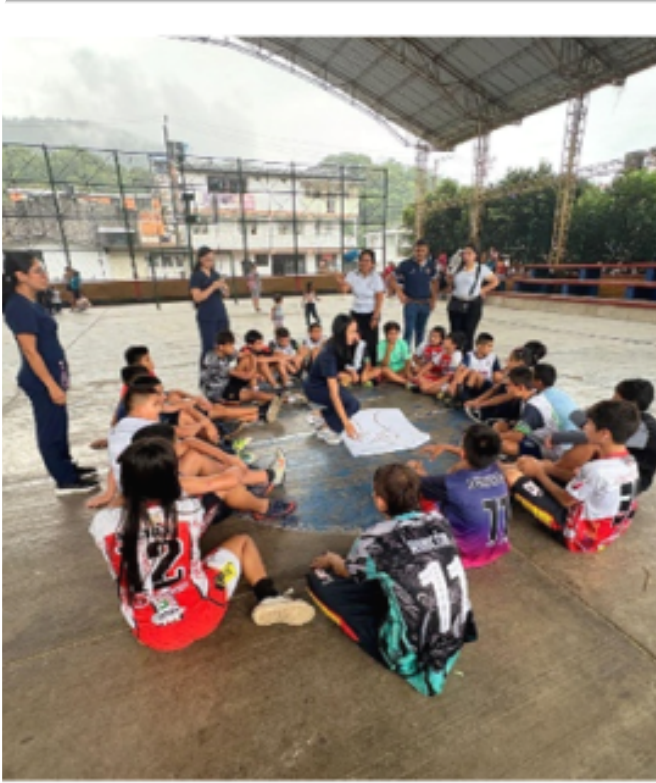
Equipo dinamizador y comunidad participante.