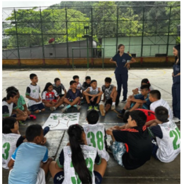
Equipo dinamizador y comunidad participante

En definitiva, esta propuesta reafirma que las estrategias de vida académica en la UNAD no solo enriquecen el proceso educativo, sino que también contribuyen a la transformación social, al empoderamiento juvenil y a la construcción de una ciudadanía más justa y solidaria.