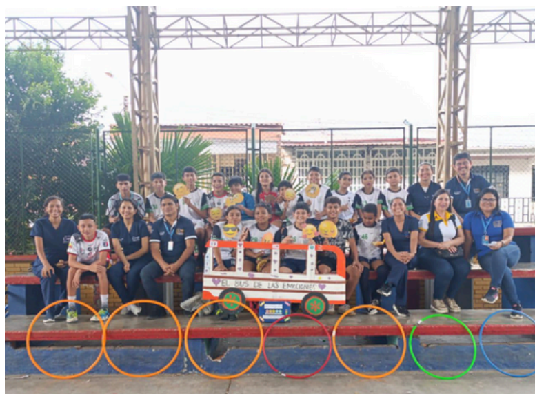
Equipo dinamizador y comunidad participante