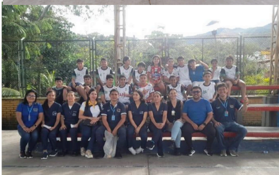
Equipo dinamizador y comunidad participante