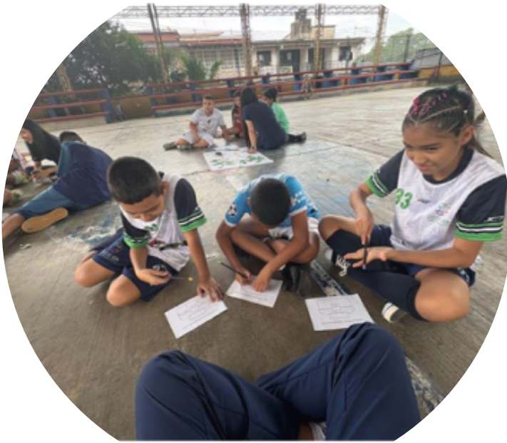
Equipo dinamizador y comunidad participante