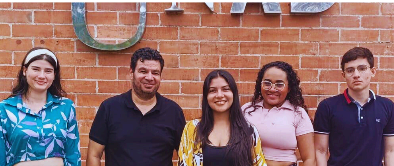
Fotografía del semillero estudiantes BS