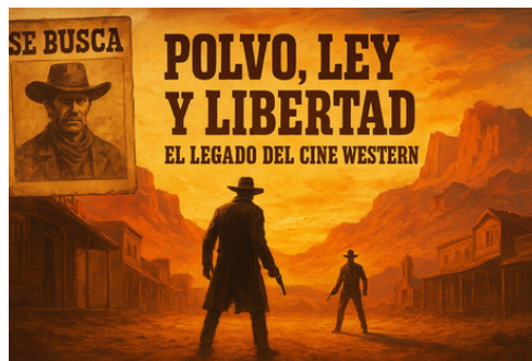
Pieza grafica del evento Cine Western, 6 de noviembre 2025