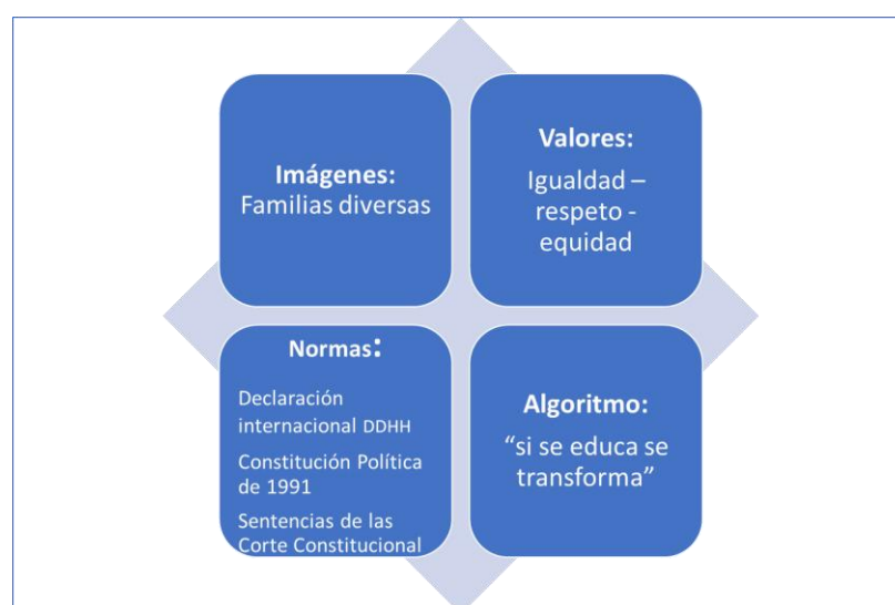
Imagen Referencial de Política

La siguiente imagen presenta visualmente la estructura y constitución del referencial de política por cada una de sus categorías.