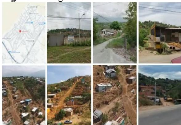
Figura 5: Un grito de revolución silencioso