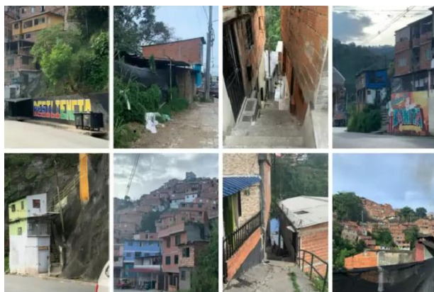
Figura 3: Reconstruir con fe, arte y unión