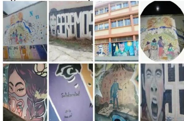
Figura 2: Las voces que hablan mediante imágenes.