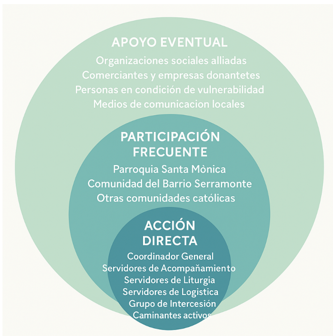
Diagrama de Conjuntos de Acción

Nota. Elabora propia resultado del análisis de la frecuencia de comunicación interna y externa de la comunidad Emaús.