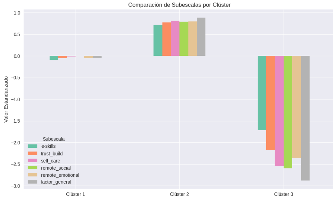
Figura 1 Comparación subescalas por clústeres