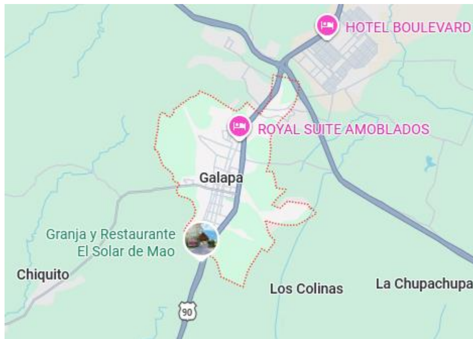
Figura 1. Ubicación del municipio Galapa, Atlántico

oportunidades educativas y la necesidad de fortalecer los procesos de participación ciudadana y control social en la gestión pública (Gobernación del Atlántico, 2025).