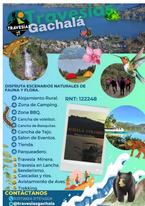
Poster Travesías Gachalá